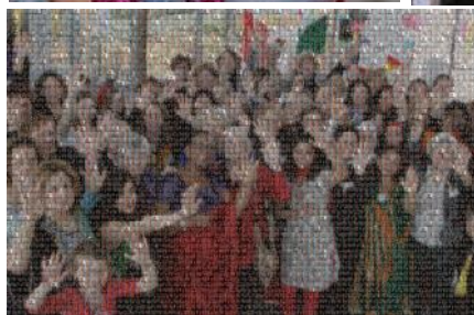
Deze laatste foto is een mozaïek dat is opgebouwd uit portretten bezoekers van Internationale Vrouwendag 2017.